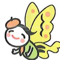
池田家墓所キャラクター池藩チョウ