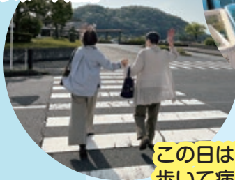
通院付添いのサポート活動